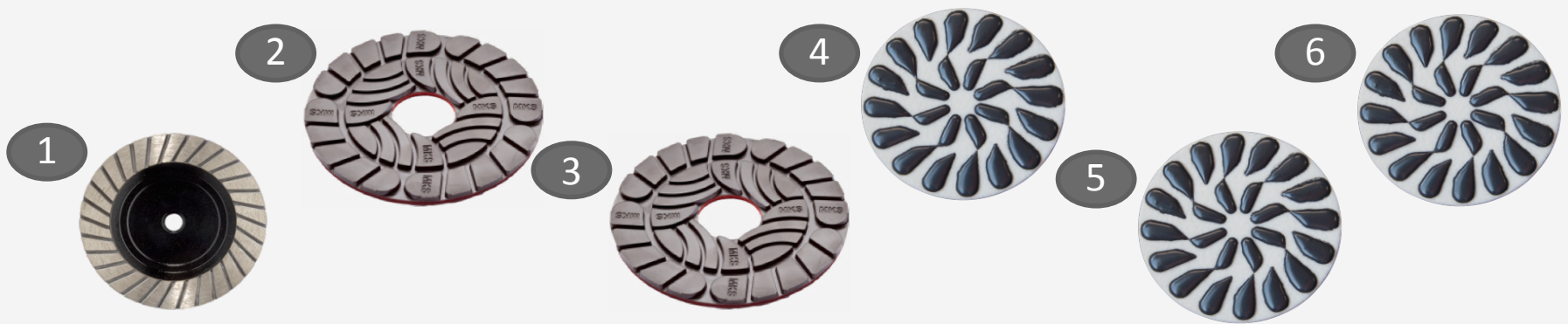
Randbearbeitungswerkzeuge / tools for edge working